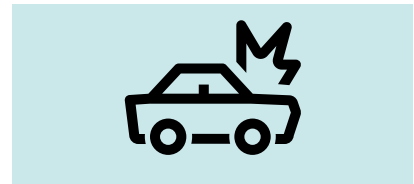
Rasche, problemlose und unbürokratische Schadenabwicklung

In MobilER GO! ist alles drin, was Sie brauchen: